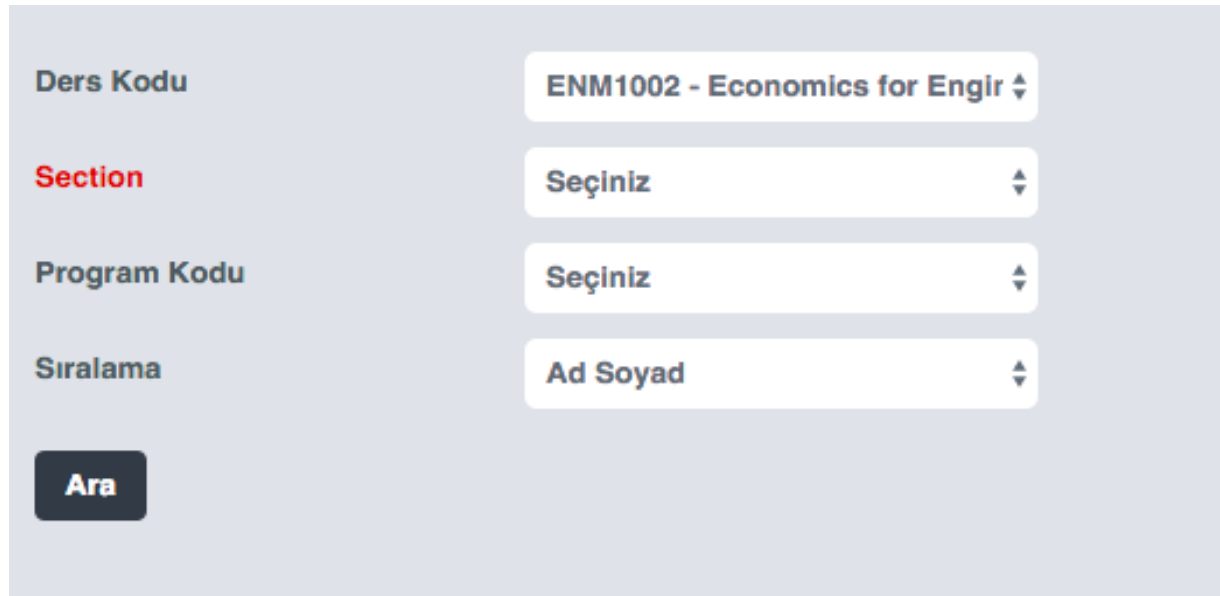
Şekil 5 – Not Girilecek Ders Arama Ekranı

Şekil 5 ve 6 not giriş ekranlarına örnektir.